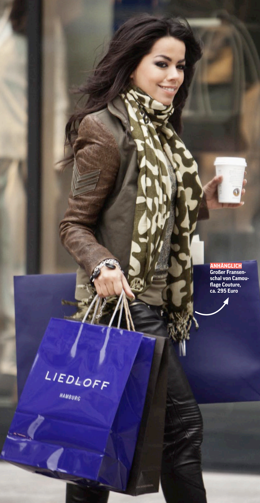
ANHÄNGLICH Großer Fransenschal von Camouflage Couture, ca. 295 Euro