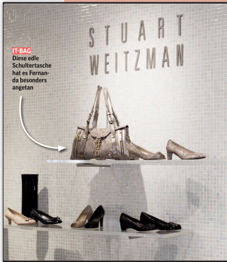
IT-BAG Diese edle Schultertasche hat es Fernanda besonders angetan